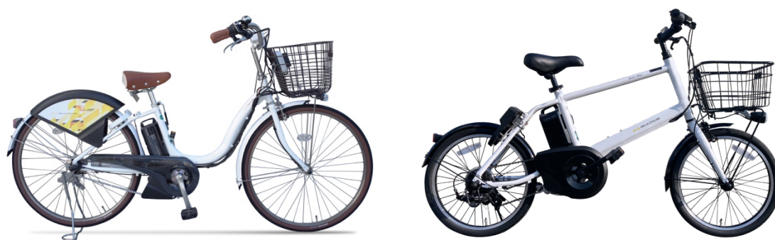
豊橋市と湖西市で利用できる電動アシスト自転車

マルシメと OpenStreet は今後、サービス展開地域の拡大やステーション増設を進めていく他、各市町村との連携による公有地へのステーション設置なども進めていく予定です。