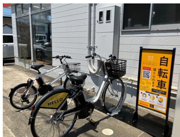
ラビット 豊橋向山大池横