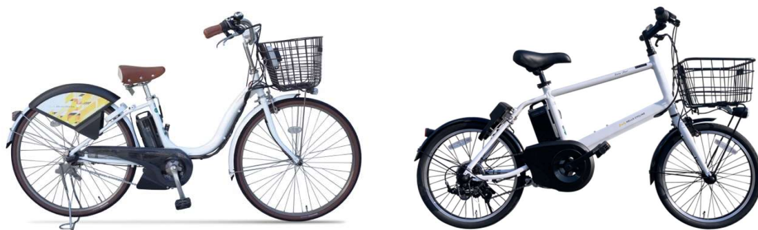
愛知県新城市で利用できる電動アシスト自転車

マルシメと OpenStreet は今後、サービス展開地域の拡大やステーション増設を進めていく他、各市町村との連携による公有地へのステーション設置なども進めていく予定です。