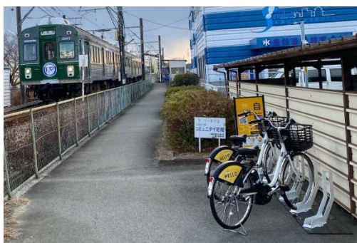
豊橋鉄道渥美線芦原駅ステーション