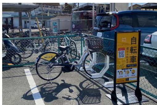
豊橋鉄道市内線赤岩口電停ステーション

豊橋市内のステーション場所は こちら 、新城市内のステーション場所は こちら をご確認ください。